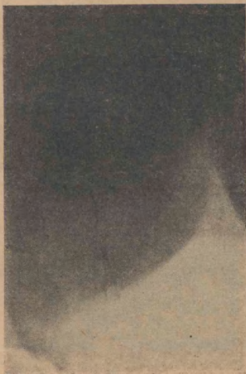
FIG. 10 Deferente con obstrucción yuxtaepididimaria