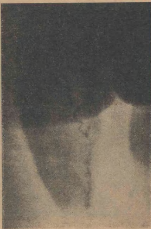
FIG. 11 Obstrucción de cole de epididimo