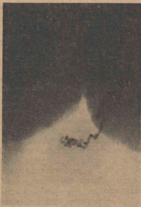
FIG. 2 Epididimo y deferentes normales

el deferente al desnudo; la falta de defensa al trauma es mucho mayor si no tiene elementos para su movilización celular conjuntiva y la irrigación necesaria.