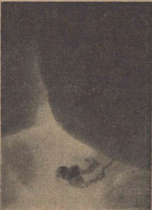
FIG. 5 Epidídimo y deferentes normales