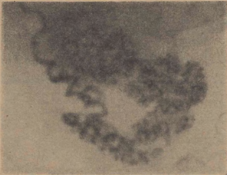
FIG. 19 Ampliación del epidídimo derecho de la FIG. 16