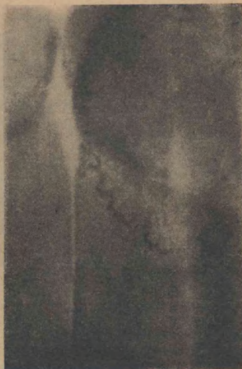
FIG. 9 Deferente con obstrucción yuxtaepididimaria