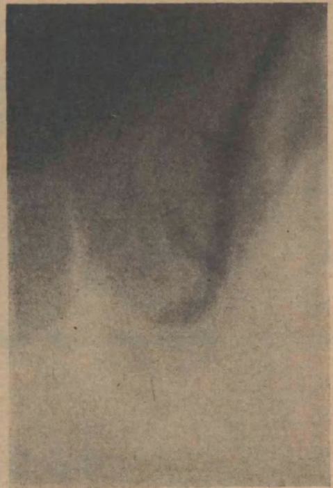
FIG. 13 Obstrucción de cole de epididimo