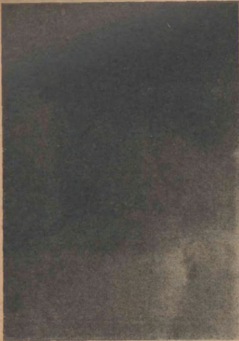
FIG. 12 Obstrucción de deferente yuxtaepididimario