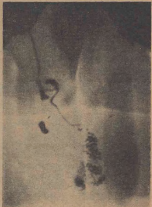
FIG. 6 Deferente y epidídimo normales