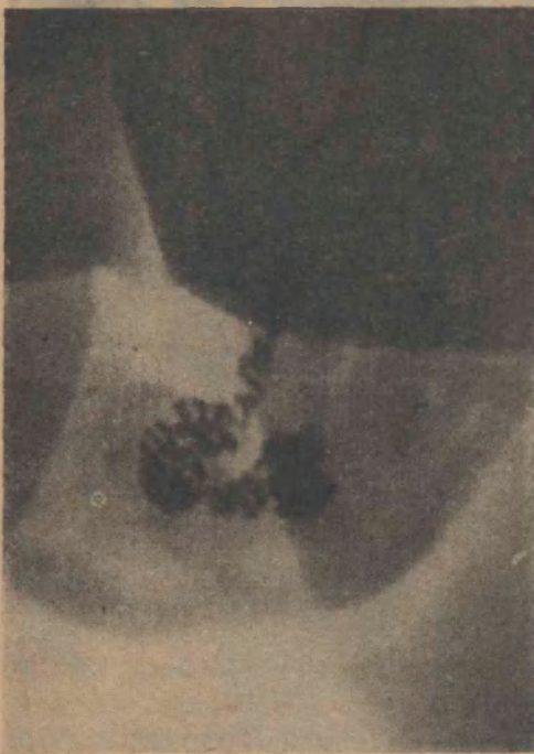
FIG. 14 Vasotomía profiláctica 3 meses antes. Dila- tación tubos deferentes epididimarios