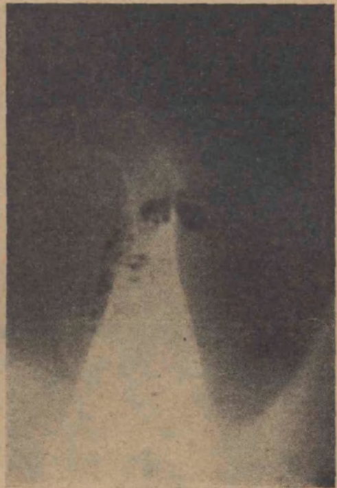
FIG. 4 Epidídimo y deferentes normales