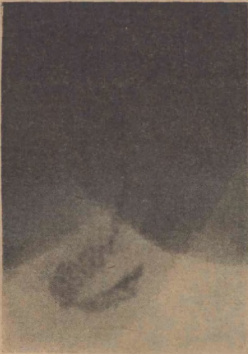
FIG. 3 Epidídimo donde se observa cole y parte de cuerpo