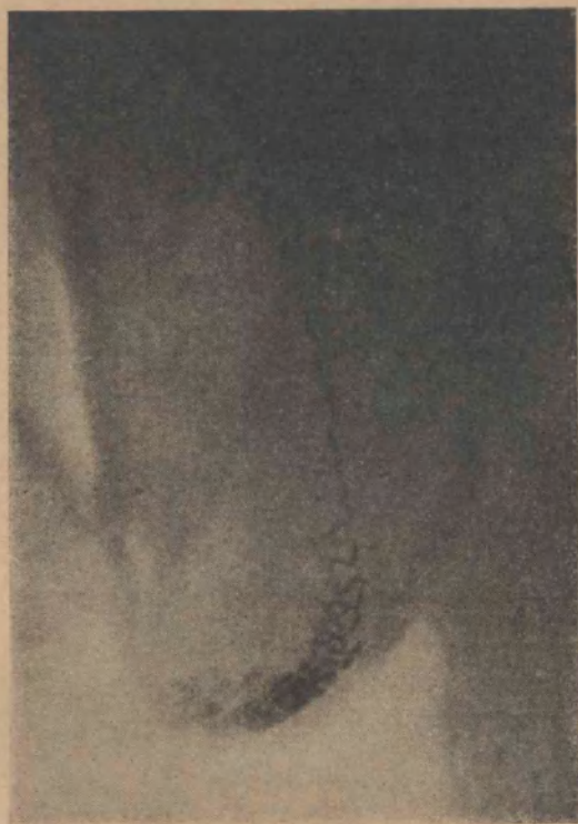
FIG. 8 Epididimo y deferentes normales