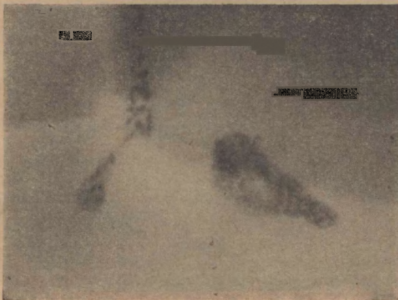
FIG. 17 Dos epididimos propios con órganos en distinta posición