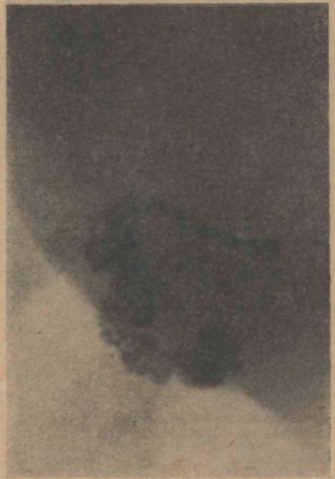
FIG. 15 Vasotomía profiláctica 10 meses antes. Mayor dilatación insular