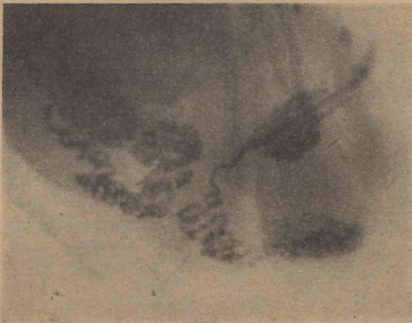
FIG. 16 Lado derecho: Deferente y epididimo inyectados totalmente. Orquitis mediana. Lado izquierdo: Deferente y epididimo normales