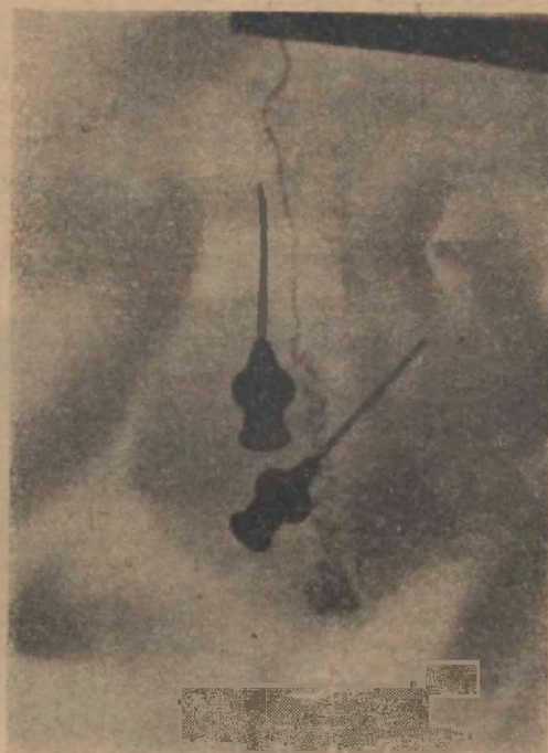
FIG. 21 El anterior inyectado a 68-70 cms. de mercurio