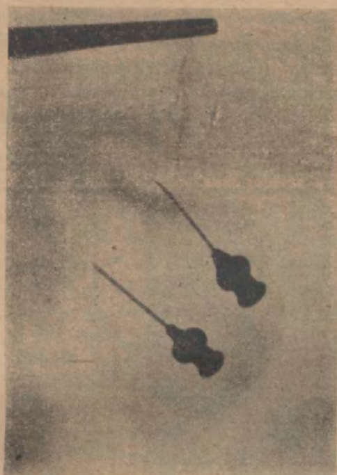
FIG. 20 Deferente y epididimo de cadáver inyectado a 42 cms. de mercurio de presión