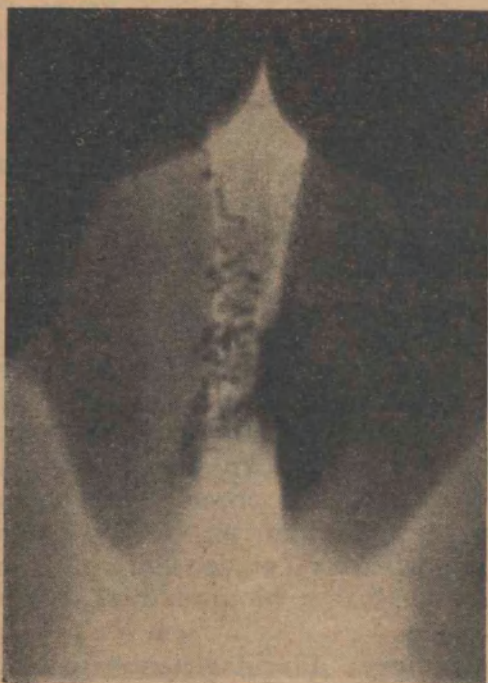
FIG. 1 Epididimo y deferentes normales

Se incide la piel y se repara el deferente, seccionándose entonces la fibrosa del cordón y se aísla el conducto con su arteria; insistiendo en decir que no es de ninguna manera conveniente y consideramos riesgoso el dejar