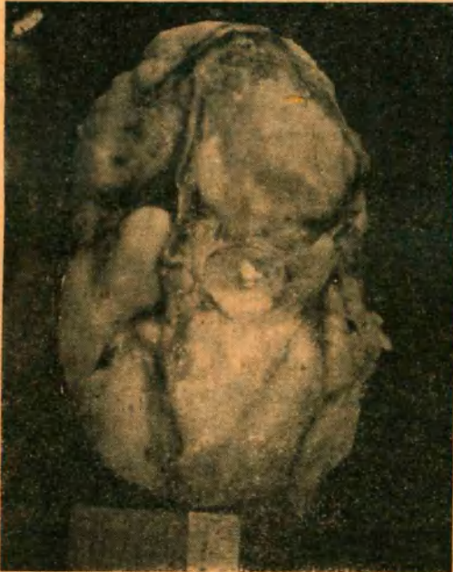
Fig. Nº 2. — Pieza operatoria