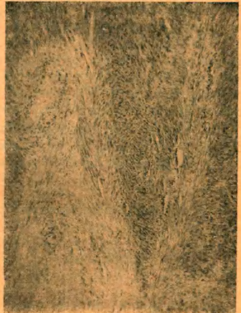
Nº 3. — Microfotografía panorámica.