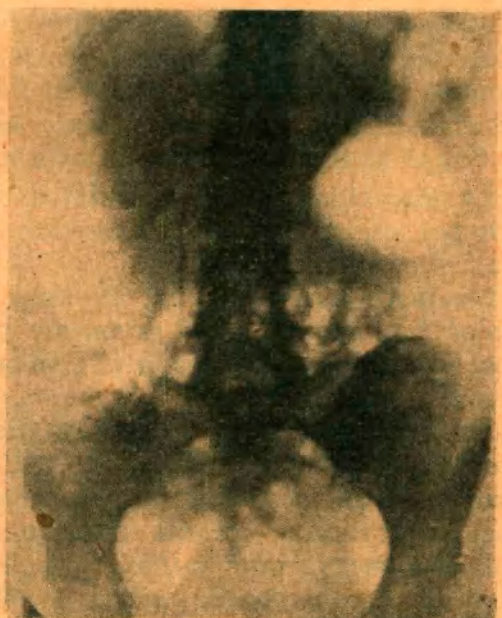
Figs. 4 y 5. — Quiste aerífero retroperitoneal. Urografía excretora en decúbito y posición de pie. post-operatoria.