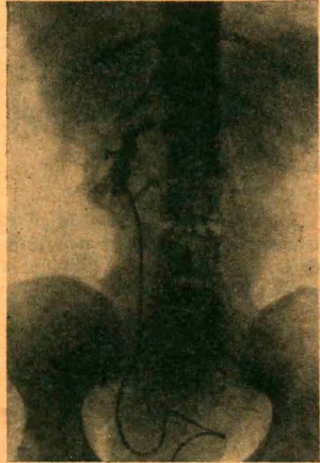
Figura 2 La misma paciente después de la quistectomía.

insinúa hasta el pedículo; la punción dió 75 c.c. de líquido ambarino. Con gran dificultad se efectúa la quistectomía abriéndose el cáliz medio que es suturado con catgut simple 000. Se coloca un trozo de Spongostan y se cierra la cavidad resultante con puntos profundos ee X; "drenaje postural" que sale a 5 cm. del extremo inferior de la herida y cierre de la pared por planos: piel con algodón.