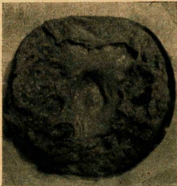
Pieza operatoria: Se observa numerosos quistes; macroscópicamente era un típico riñón poliquístico. Algunas cavidades en pleno parénquima.