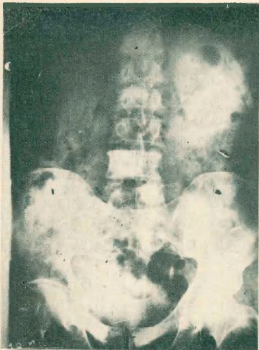
Fig. 1 - Caso 1

El 30/3/70 se le efectúa orquiectomía subepididimaria y ligadura de ambos deferentes, previa inyección en los mismos de lipiodol ultrafluido para efectuar deferentovesiculografía.