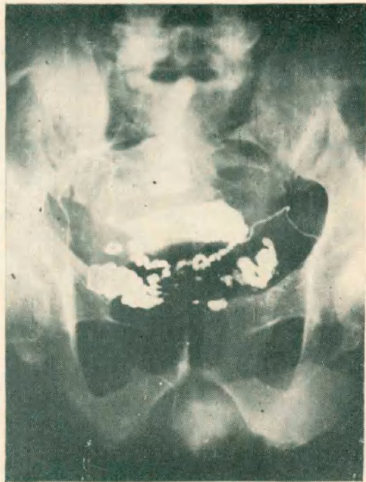
Fig. 2 - Caso 1