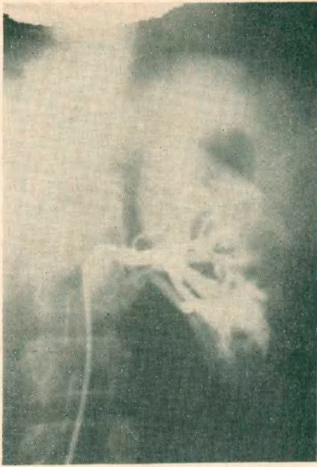
Fig. N° 1.