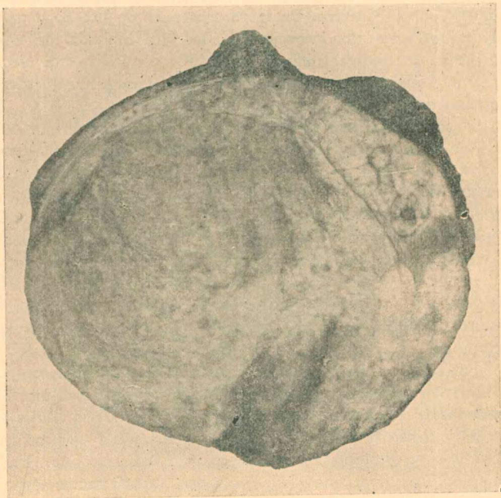
Figura N° 4

El corte de esta pieza, pasando por su plano ecuatorial y dividiendo al epidídimo por su eje mayor, nos muestra una masa blanda, friable, uniformemente repartida en todas sus partes; es de color blanco rosado y está salpicada en su superficie por numerosas pequeñas manchas rojas que le dan un aspecto mosqueado y que pa-