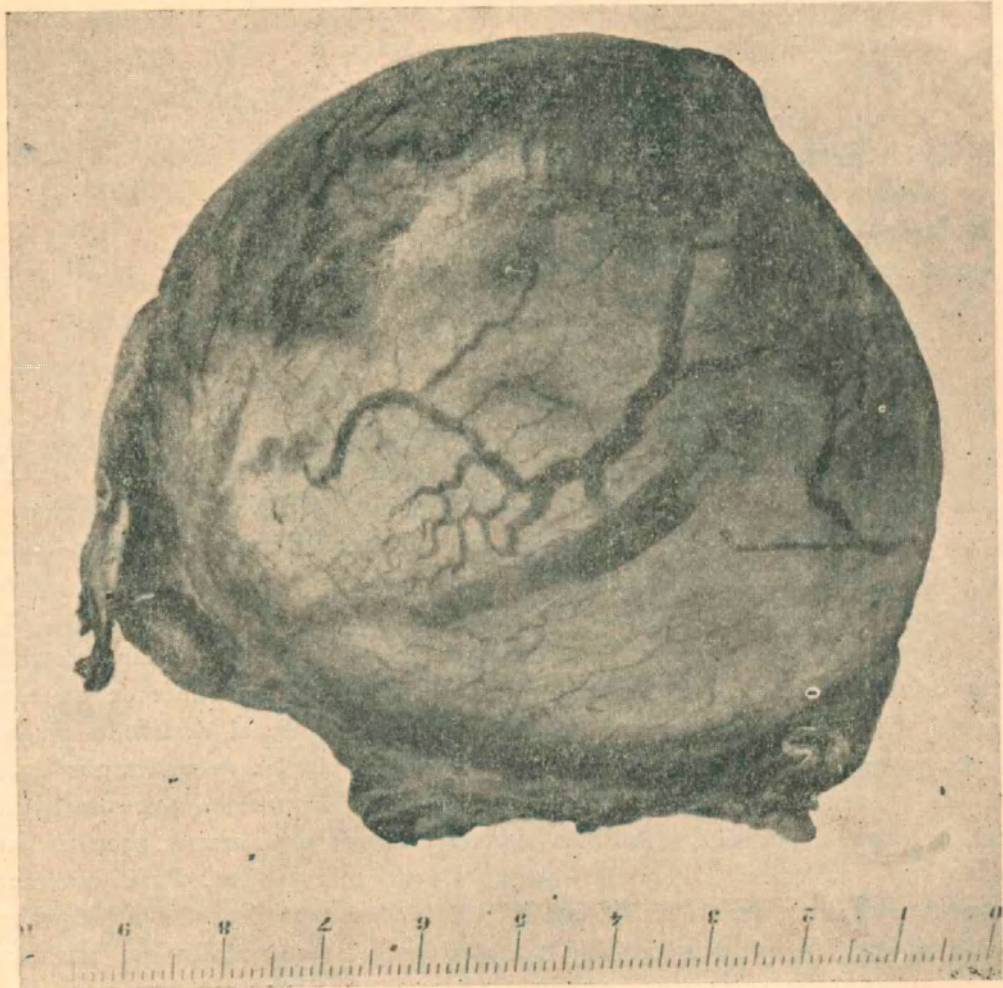
Figura No. 1. Imagen macroscópica de la pieza extraída.

El diagnóstico de un tumor de testículo exige un signo patognomónico que es el aumento del volumen de la glándula que cam-