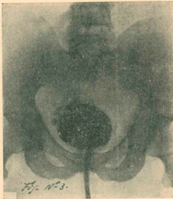
Figura N° 3

Se examina en los días siguientes el cuello de vejiga, buscando allí la causa de la retención urinaria y encontramos: un cuello hipertrófico con ahuecamiento