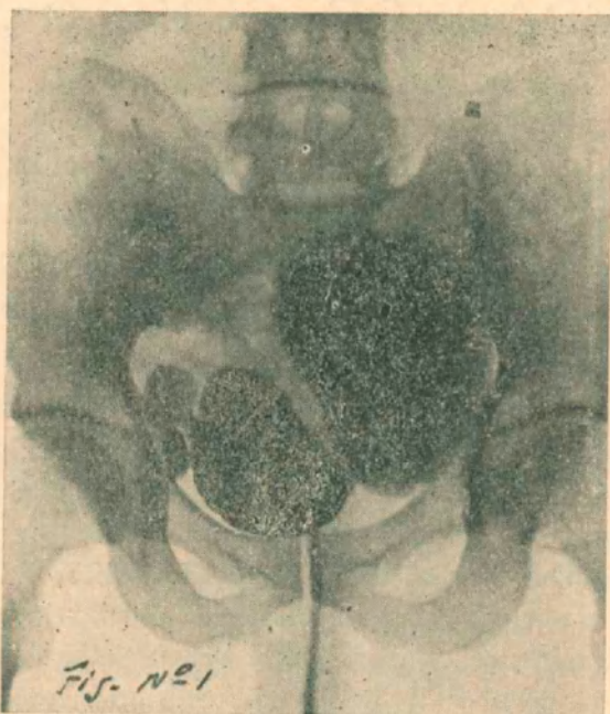
Figura N° 1

En esas condiciones se deja al enfermo en reposo en cama con una sonda de Pezzer en permanencia y terapéutica diaria de irrigación para mejorar la vejiga. Al cabo de unos 15 días se consigue, con anestesia epidural (proc. de Cathelin 45 c. c. de novocaína al 1 %) hacer un examen endoscópico que muestra la existencia, en el bajo fondo vesical de varios orificios divertículos, 3 en el lado derecho y 1 en el lado izquierdo. Aprovechando la capacidad vesical lograda con el anestésico se hace una radiografía con líquido de contraste (ioduro de