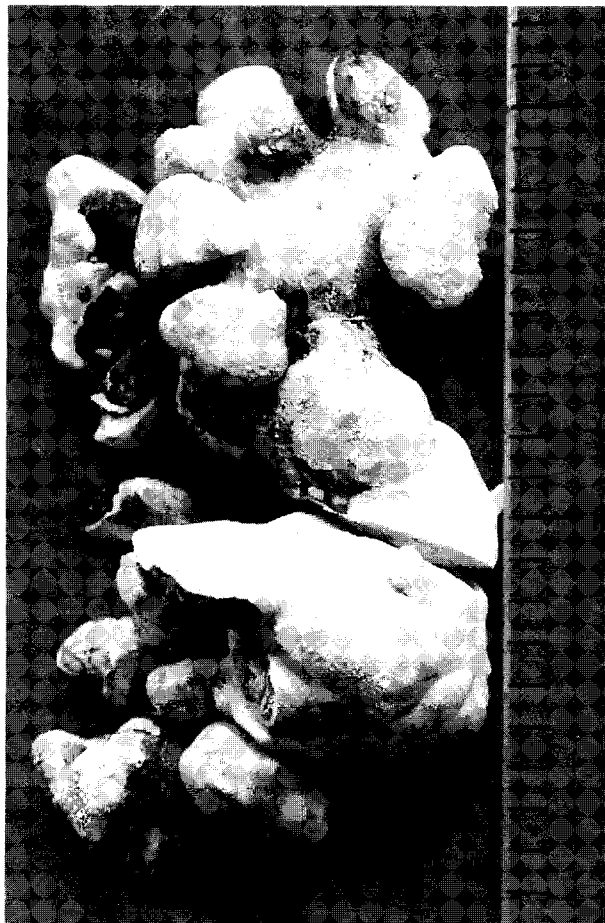
Figura 2: Cálculo coraliforme grande de 22 cm en su mayor diámetro y de 850 g de peso.

En el momento, el tratamiento de los cálculos coraliformes tiene las siguientes opciones terapéuticas: cirugía abierta, nefrolitotripsia percutánea, litotripsia extracorpórea (monoterapia) y la asociación de la litotripsia percutánea y extracorpórea. Todas las alternativas pueden presentar buenos resultados terapéuticos cuando son bien indicadas. De una forma general la nefrolitotripsia percutánea seguida de litotripsia extracorpórea o de un nuevo procedimiento percutáneo sería el procedimiento de elección en la mayoría de los pacientes con cálculo coraliforme. (3) La terapia combinada puede ser utiliza-