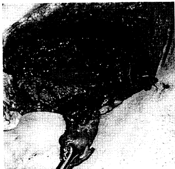
Foto 2: Uraco con el quiste infectado, disecado durante el procedimiento quirúrgico.