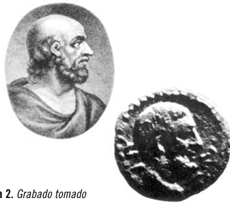
Figura 2. Grabado tomado de una joya antigua y moneda romana del Siglo I DC, con figura de Hipócrates para comparar.

que encontró en las colonias griegas del sur de Italia, específicamente en la ciudad de Crotona el centro médico-filosófico más famoso de la época. Pitágoras que había emigrado de Samos, fundó en ella una escuela donde la matemática, la aritmética y la geometría parecían gobernar la naturaleza y la música. Uno de sus discípulos, Alcmeón , natural de dicha ciudad, fue el primer médico interesado en cuestiones biológicas que practicó disecciones y vivisecciones en animales, por motivo de aprender su naturaleza, más bien que con propósitos de adivinación como era costumbre en esos tiempos. Definió claramente las diferencias entre el hombre y los animales; dijo que el hombre era la única criatura capaz de entender al mundo. Se interesó principalmente en el hombre y su libro "Sobre la Naturaleza" se ha considerado como el punto de partida de la literatura médica griega, aunque sólo se hayan conservado unos pocos fragmentos. Pensaba que la salud es la armonía y la enfermedad es la perturbación del cuerpo.