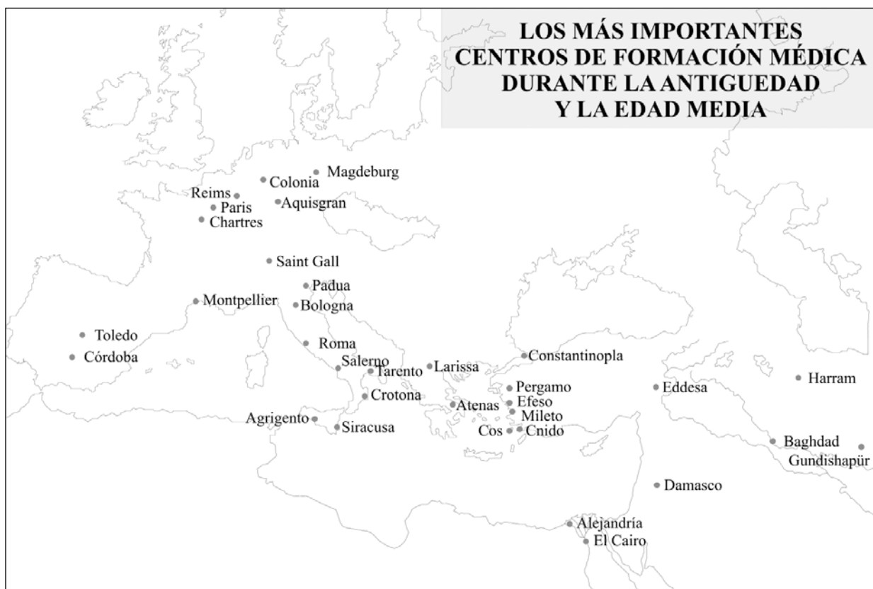
Figura 3. Mapa de los centros de formación médica durante la Antigüedad y la Edad Media.

En la “escuela neumática” se destacaron Ateneo de Atalia y Areteo de Capadocia ; mientras que para la “escuela ecléctica” lo fueron Arquígenes de Apamea , Heliodoro y Antilo quienes aportaron su gran experiencia clínica y quirúrgica en el siglo I y II d.C.