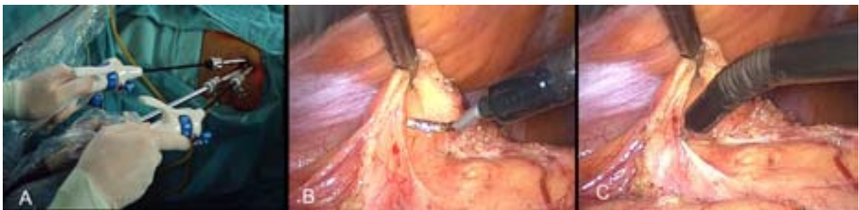
Figura 1. Imágenes operatorias de una ureterolitotomía por U-LESS. A) Posición de trócares y elementos de trabajo; B y C) Disección con pinzas flexibles.

Técnica quirúrgica (Figuras 1, 2 y 3): La vía de acceso elegida fue transumbilical transperitoneal en todos los casos. La técnica quirúrgica empleada correspondió a la misma utilizada por vía laparoscópica convencional. La posición del paciente se adoptó de acuerdo al tipo de cirugía a realizar; así, la mayoría de los casos se colocaron de decúbito lateral opuesto al lado a operar. Utilizando la técnica de abordaje abierta se realizó la colocación del dispositivo GelPort® para los casos de cirugías ablativas y/o el primer trócar de 10 mm para la óptica en el resto; la cirugía continuó con la colocación de los trócares a través del dispositivo GelPort® y/o la colocación de 2 trócares accesorios de 5 mm umbilicales a 1 cm del primer trócar. Utilizamos óptica de 10 mm de 30°, instrumentos flexibles de 5 mm (Cambridge Endo®) y otros intencionalmente doblados de forma manual para la consecución de estos procedimientos (Figuras 1 y 2). Debido a la ausencia de materiales específicos flexibles (p. ej., clipadora), en los casos de nefrectomías utilizamos instrumental recto estándar aceptando la pérdida de triangulación.