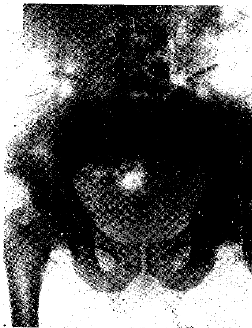
Figura N° 2

Capacidad vesical, normal. Vejiga sana. Se ve en el trigono el tubo con toda facilidad. Se le practica una radiografía de control que ustedes pueden ver y se resuelve intervenir.