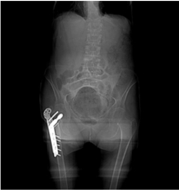
Figura 1. TAC (Topograma): Gran cantidad de gas ocupa la cavidad vesical.