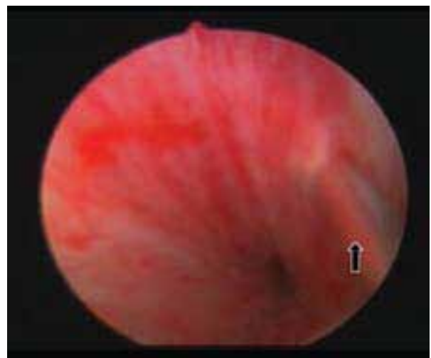
Figura 1. Imagen endoscópica de la infiltración del esfínter externo masculino (flecha).

El efecto terapéutico del BoNT-A comienza a las 48 horas de aplicado, se consolida a las 2 semanas y se extiende hasta 6 meses. De los 12 pacientes, 8 pudieron suspender el cateterismo. Los 4 restantes no lograron la micción espontánea completa, considerándose como fracaso terapéutico. De éstos, 2 eran varones lesionados medulares incompletos, uno era completo y 1 era una mujer con hiperactividad de piso pelviano. Ningún varón presentaba detrusor arrefléxico como posible causa de fracaso, ya que la actividad vesical se encontraba presente, en cambio en la mujer con hiperactividad del piso pelviano no se pudo registrar actividad vesical (Tabla 1).