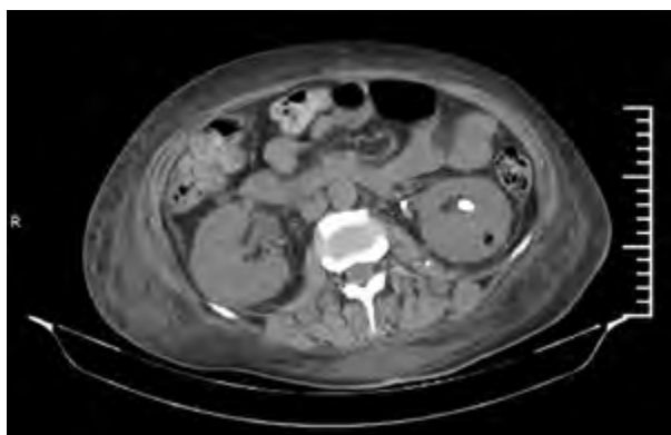
Imagen 2. TAC abdominal. Cuatro días posteriores a nefrostomía se observa catéter en posición con aire en corteza de valva posterior del riñón izquierdo.

Dado el cuadro de la paciente, se decide efectuar nefrostomía percutánea izquierda. La paciente presenta mejoría clínica y de los resultados de laboratorio luego de realizar nefrostomía percutánea izquierda, excepto el control de la glucemia que requiere algunos días más para su corrección. Se realiza nueva TAC 4 días posteriores a la nefrostomía, donde se observa catéter de nefrostomía izquierda en posición con aire en corteza de valva posterior del riñón izquierdo (Imagen 2). Hemocultivos x 2 positivos y urocultivos positivos para Escherichia coli . Se ajusta sensibilidad a piperacilina y tazobactam. Urocultivo de nefrostomía negativo. Luego de 15 días de tratamiento antibiótico, y al presentar mejoría clínica, la paciente se externa con controles por diabetología e urología. Luego, se retira nefrostomía y se realiza nueva TAC, en la que se evidencian riñones sin aire en corteza ni secuelas (Imagen 3).