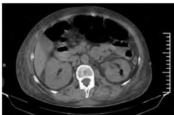
Imagen 1. TAC abdominal.

creatinina: 0,8 mg/dl y osmolaridad plasmática elevada. Con estos hallazgos, se interpreta síndrome hiperosmolar no cetósico y cómo, a su vez, presenta un sedimento de orina patológico se indica ciprofloxacina (200 mg) por vía endovenosa cada 12 horas como tratamiento empírico. La ecografía renal informa riñón izquierdo aumentado de tamaño y evidencia dos imágenes heterogéneas (¿aire?). Sin dilatación de vía excretora. En la tomografía axial computarizada (TAC) se evidencia tórax con aumento de intersticio peribroncovascular bilateral, derrame pleural bilateral a predominio derecho. A nivel basal derecha consolidación con broncograma aéreo. En el riñón izquierdo se observa aire a nivel cortical compatible con pielonefritis enfisematosa y distensión del marco colónico (Imagen 1).