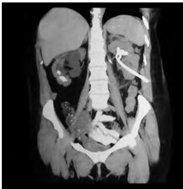
Imagen 5. TAC de control en la que no se evidencia colección retroperitoneal.

El urocultivo realizado al ingreso arroja una Klebsiella pneumoniae sensible a vancomicina más ceftriaxona (resistente a ciprofloxacina), motivo por el que se rota el esquema antibiótico. Se realiza nefrostomía percutánea izquierda con toma de muestra para urocultivo: negativo durante el primer día de tratamiento con vancomicina más ceftriaxona, motivo por el que se rota a cefalotina. La paciente evoluciona favorablemente con nefrostomía funcionante y permeable con débito de orina clara a través de la misma. Al octavo día de iniciado el tratamiento se suspende vancomicina y al octavo día posoperatorio se realiza TAC de control que evidencia colección retroperitoneal. Se realiza drenaje percutáneo de la colección retroperitoneal, que presenta 320 cc de débito de material purulento durante el primer día posoperatorio. El cultivo del material desarrolla Klebsiella pneumoniae sensible a cefalotina y piperacilina-tazobactam, y se inicia tratamiento empírico con piperacilina-tazobactam. Al octavo día de efectuado el drenaje se realiza TAC de control (Imagen 5), en la que no se evidencia colección retroperitoneal, motivo por el que se retira el drenaje percutáneo. Infectología decide completar 15 días de tratamiento con piperacilina-tazobactam. La paciente presenta buena evolución clínica y de los parámetros de laboratorio. Se realiza radiorrenograma basal que informa funcionalidad de ambos riñones. Posteriormente, se efectúa nefrolitotricia percutánea bilateral.