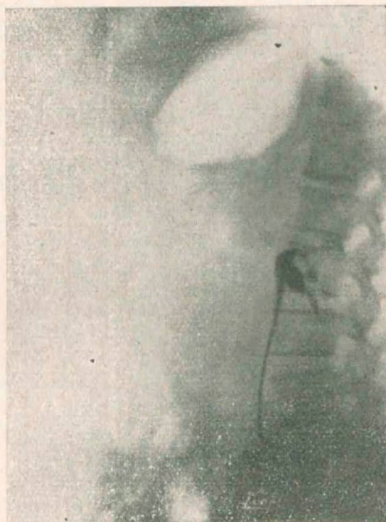
Fig. N° 2. — Pielografía derecha (de relleno) de perfil

lo forma la tangente que pasa por el cuerpo vertebral de la primera lumbar; la sombra quística borra la sombra de los dos tercios inferiores del riñón; la vía excretora renal de ese lado (ureter con sonda opaca), indica una ligera desviación hacia la línea media, rechazo producido, al parecer por la sombra tumoral. La pielografía de frente indica que la vía excretora del lado derecho, conserva sus caracteres vecinos de lo normal: el relleno pielocaliciforme, no es perfecto; pero llama la atención la superposición de sombras —la del tumor y la del