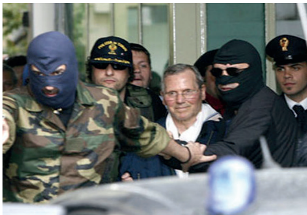
Bernardo Provenzano el Padrino de la Mafia fue arrestado en Sicilia en 2006

Pero resultaba ser que éste había utilizado un nombre falso y que se había querido operar en Francia, porque realmente era Bernardo Provenzano originario de la villa Barcellona Pozzo di Gatti en Sicilia, un “capo di tutti capi” de la mafia siciliana, buscado afanosamente por la Policía Italiana.