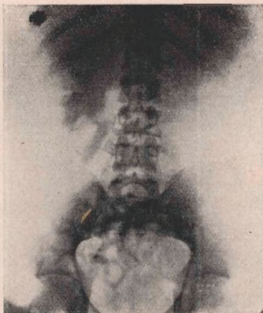
Figura N° 3 Per-Abrodil a los 30'

Durante los días que permanece el enfermo en el Servicio, se controlan los volúmenes urinarios de 24 horas, dando una poliurea de 2,500 a 2,700cc., con concentraciones parecidas a las encontradas en el cateterismo. Por razón de la incultura del enfermo que ha rechazado nuevas investigaciones, nos hemos privado